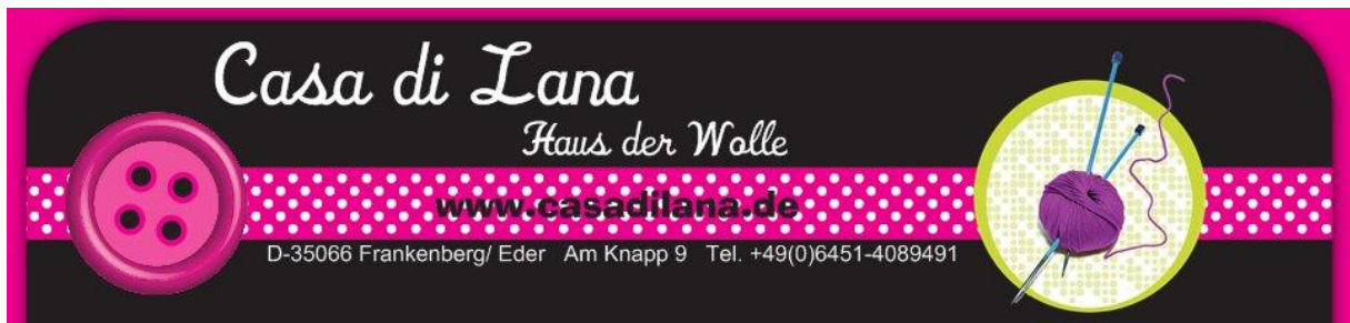
Toga of Thrones by Casa di Lana/ Haus der Wolle