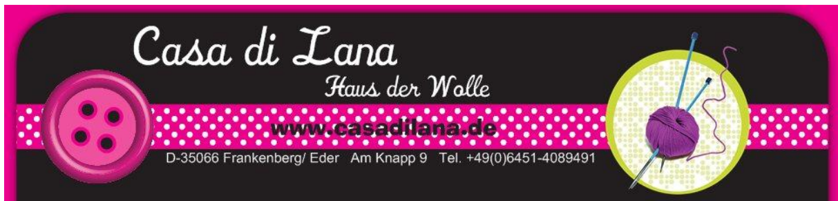
Toga of Thrones by Casa di Lana/ Haus der Wolle